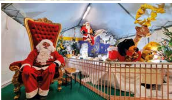
La maison du Père Noël