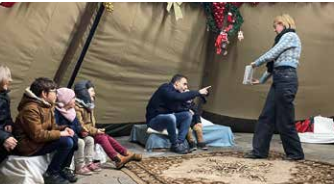
Lecture de Contes par la Bibliothèque Municipale