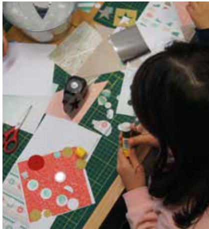
Atelier par Les Bricolheux