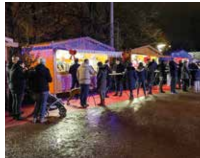
Les chalets des commerçants et associations