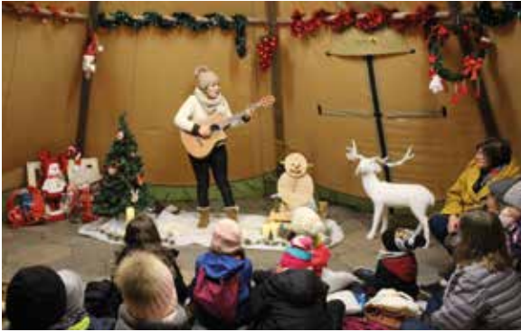
Spectacle Tournée des Petits Flocons

Retour en image sur le Village de Noël et ses animations, organisés au Parc Municipal.