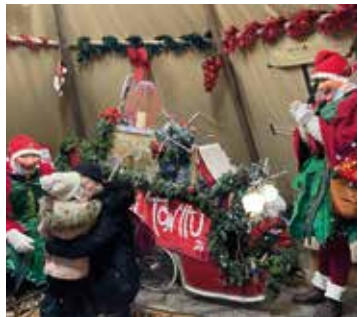
Les Posti-Tonttu - La poste des souhaits