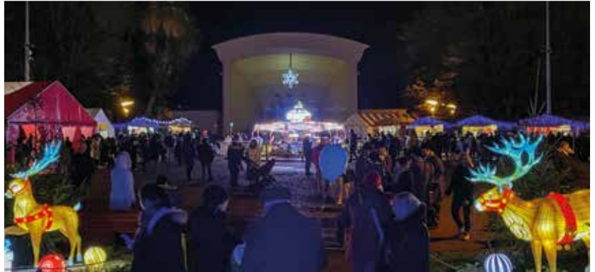
La Route des Lanternes