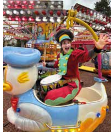
Les Tambours par la Compagnie Transe Express