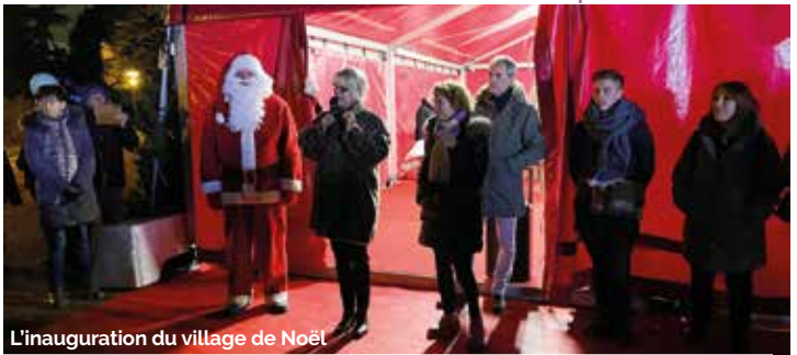
L'inauguration du village de Noël